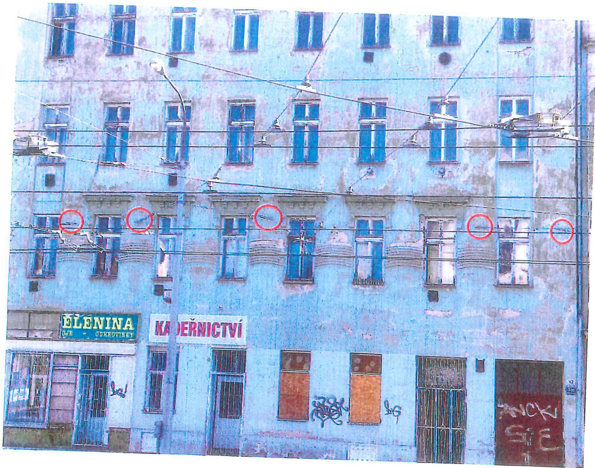
Kotvy trakčního vedení